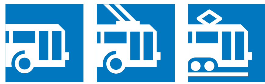
Схема маршрутов наземного транспорта центра Москвы Surface Transport Network in Central Moscow